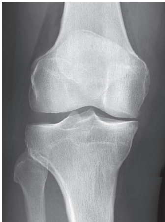
Röntgenbild eines Kniegelenkes rechts von vorne mit Gelenkspaltverschmälerung der Innenseite

Häufig sehen wir während der Untersuchung die typische O-Beinkonfiguration. Wenn es bei Ihrem Gangbild noch zu einem verstärkten Wegknicken des Beines in O kommt (Varus thrust) wird es kritisch für Ihr Knie. Dann ist nicht nur die Innenseite auf Druck belastet, sondern die Bänder der Aussenseite auf Zug, das Problem potenziert sich. Schwellung, Druckschmerz, die typischen Zeichen der Überlastung der Innenseite auf Röntgen-, MRI-, eventuell SPECT/CT-Bildern beweisen die Problematik.